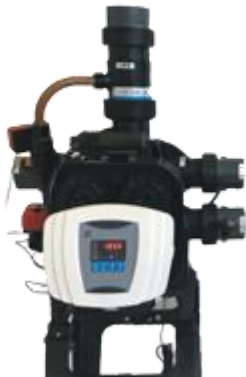
( imagen no contractual )